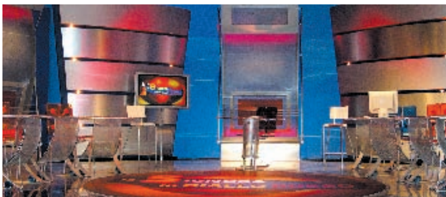
Lo studio de “La Signora in Giallorosso”