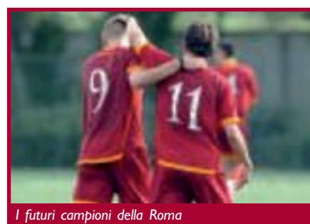
I futuri campioni della Roma